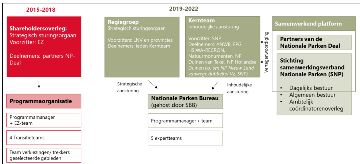
Figuur 2 Overzicht van de voormalige en huidige organisatiestructuur van het Programma

Sinds 2019 wordt het Programma aangestuurd door de Regiegroep. Het shareholdersoverleg, dat van 2015 tot 2018 bestond, is hiermee komen te vervallen. De Regiegroep is verantwoordelijk voor de strategische aansturing en heeft besluitvormend mandaat. Het besluit onder andere over het jaarplan en ziet toe op de voortgang via de jaarlijkse verantwoordingsrapportage.